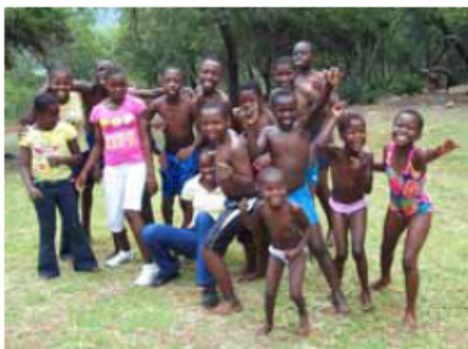
Zukunft für Afrika – dazu trägt der Verein „Ingenieure ohne Grenzen“ bei.

Werkzeugkästen mit dem alten HSE-Logo finden in Afrika eine sinnvolle Bestimmung. Die HSE spendet sie zusammen mit weiteren Werbemitteln, die in Deutschland nicht mehr eingesetzt werden können, an den Verein „Ingenieure ohne Grenzen“. Insgesamt werden rund 165 Werkzeugkästen,